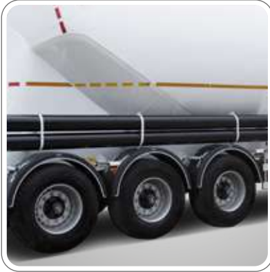
3x9 TON KAPASİTELİ DİNGİL