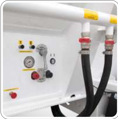
W KONİK BOŞALTIM SİSTEMİ 20-25 dk.