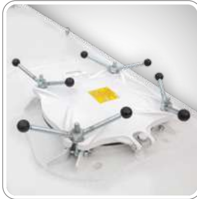
DÖNER MAFSALLI MENHOL KAPAĞI