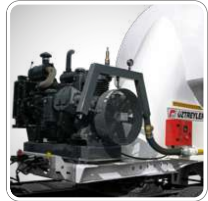
OPSİYONEL ELEKTRİKLİ DİZEL KOMPRESÖR