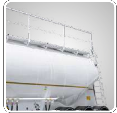
PNÖMATİK VEYA MEKANİK AÇILABİLEN KORKULUK