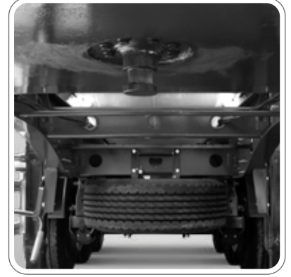
2" CIVATA İLE SÖKÜLEBİLEN FLANŞLI KING-PİNİ

ÖNDEN TELESKOPIK, MİNİMUM 45°-48° KALDIRMA AÇISI