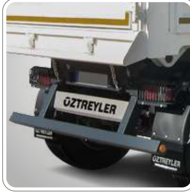
E TİP BELGELİ SABİT TAMPON