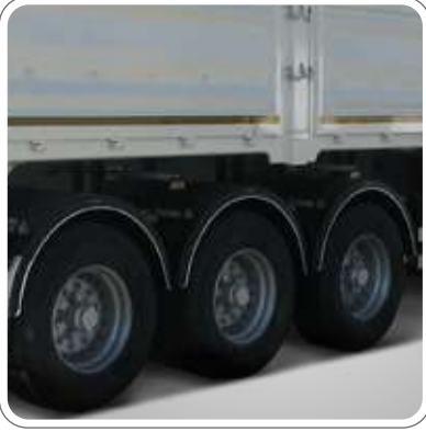
3x9 TON KAPASİTELİ DİNGİL