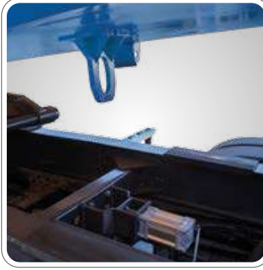
YENİ AITM YÖNETMELİĞİNE GÖRE HAREKET HALİNDE DAMPERİN KALKMASINI ENGELLEYEN KİLİT SİSTEMİ