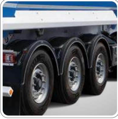
3x9 TON KAPASİTELİ DİNGİL