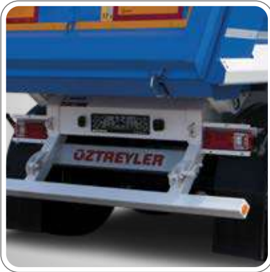
SABİT TİP TAMPON (KUM VE HAFRİYAT) KATLANIR TİP TAMPON (ASFALT DÖKÜMÜ)