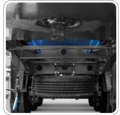
2" CIVATA İLE SÖKÜLEBİLEN FLANŞLI KING-PİNİ