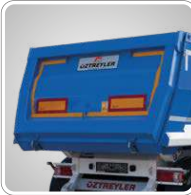
MANUEL VE HİDROLİK OPSİYONLU ÖZEL DİZAYN VE GÜÇLENDİRİLMİŞ ARKA KAPAK