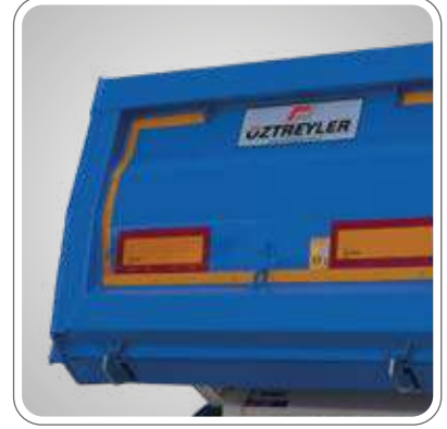
ASFALT TAŞIYICILAR İÇİN ÖZEL DİZAYN ARKA ÇIKINTI MESAFESİ